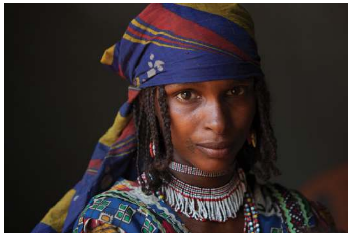
Jonge Berber moeder. Leeft met grote kuddes kamelen tussen de grenzen van Ethiopië, Zuid-Sudan en Kenia.